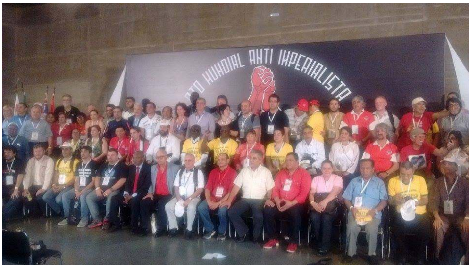
FISE participa de el simposio internacional sindical en Sao Paulo, Brasil, organizado por la Federación Sindical Mundial y la CTB