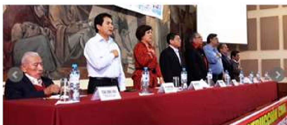
Realiza la CTC de Cuba de conjunto con el Sindicato de Trabajadores Agropecuarios y Forestales, acto por la celebración del 3 de Octubre.