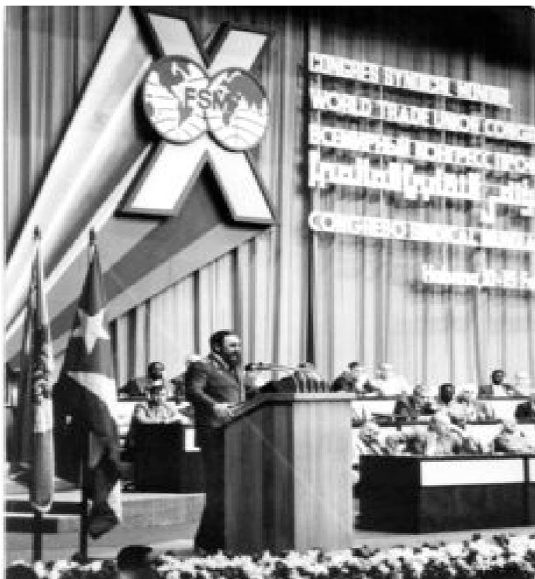
Fidel durante las sesiones del X Congreso de la FSM efectuado en La Habana en febrero de 1982.